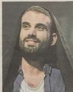
Stan, un volcan de culture au Complexe.

Son spectacle Quelque chose en nous de Vinci est complètement foutraque. On y rencontre des enfants pénibles persuadés d'être de futures stars, un employé des Galeries Lafayette atteint du "syndrome Mickaël Jackson" (entendez