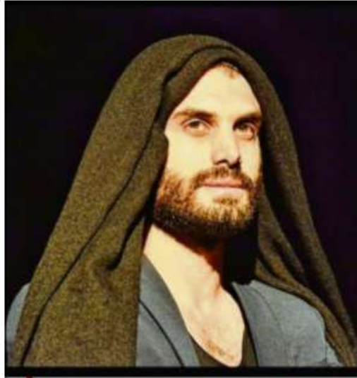
De la Joconde (notre photo) à la Vénus de Milo, de "l'homme enceint" au rappeur avéré, il met l'humour de manière subtile au service de la poésie.