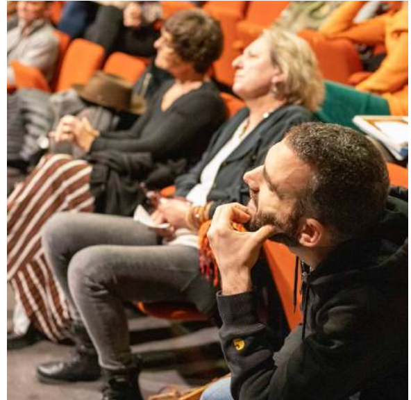
Atelier de théâtre au Théâtre Les Arts d'Azur du Broc