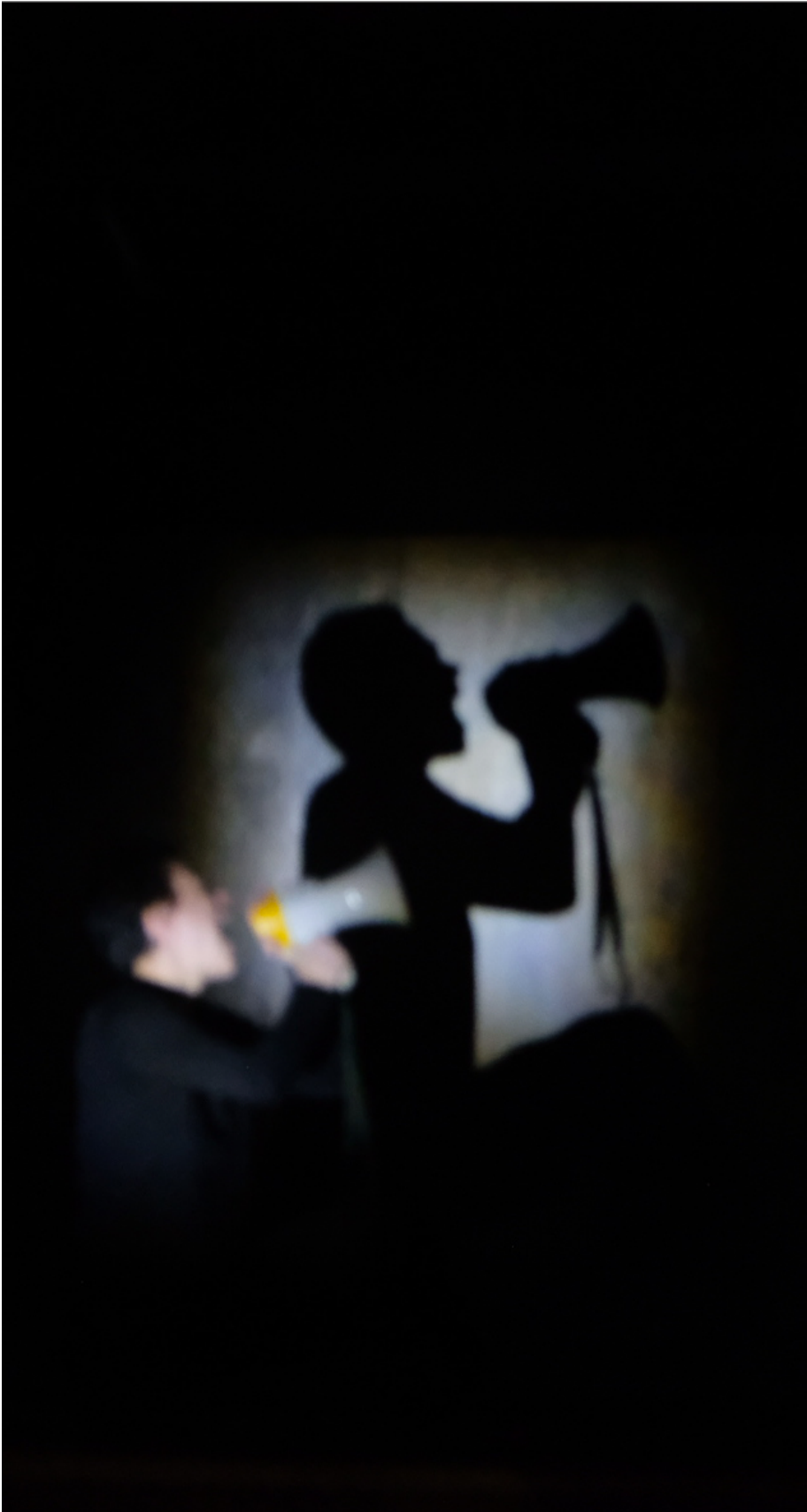
Photographies de répétition