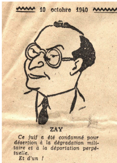
Caricature diffusée dans le journal Gringoire le 10 octobre 1940

« On l'a tout de même eu, ton fumier de mari, ce youtre, symbole vivant de l'ordure d'un régime qui de 1919 à 1939 a conduit notre pays à la guerre, à la défaite et à la ruine ».