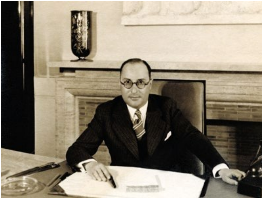
Jean Zay à son bureau du ministère de l'Éducation Nationale

Extrait du texte « Souvenirs et solitude » – 17 janvier 1941