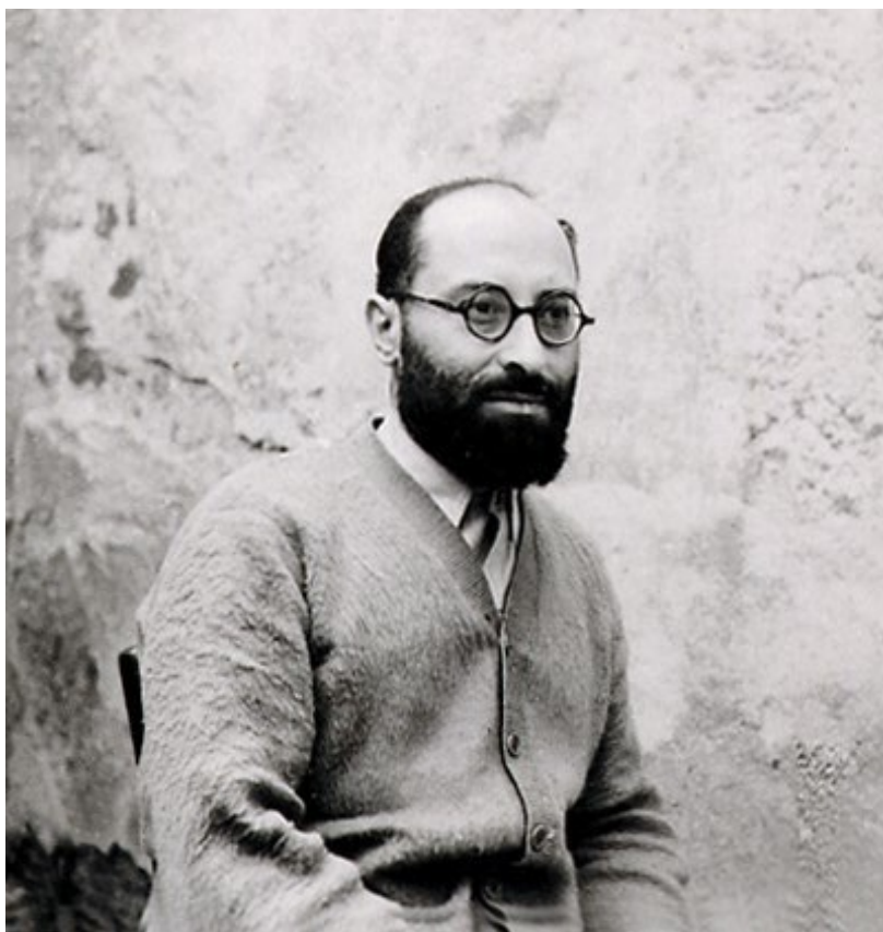
Jean Zay à la prison de Riom

« ... Il faut un effort pour estimer encore en soi l'homme complet , avec tous ses moyens endormis. Il faut à chaque instant faire jouer sa pensée, comme on fait jouer ses muscles, pour se sentir intact, riche de sève et de volonté. Alors le souvenir des jours passés, la certitude de la liberté intérieure, l'espérance de la délivrance peut-être proche et des activités retrouvées surnagent soudain comme la planche de salut. Et vous êtes sauvé. »